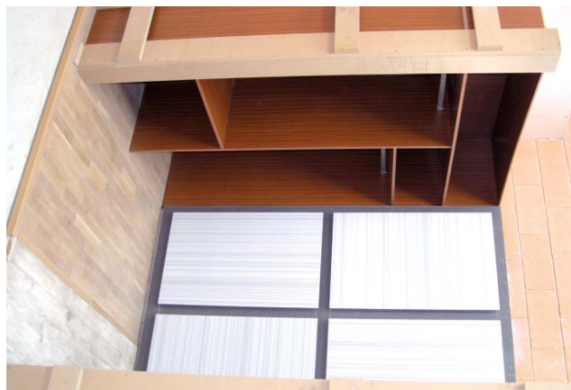
Estas imágenes reflejan algunos de los trabajos que realizarán los participantes en la actividad formativa "Instalador de elementos de carpintería"

La Confederación Empresarial de la Provincia de Alicante (Coepa) integrada en la Confederación de Organizaciones Empresariales de la Comunidad Valenciana (Cierval) ha programado el curso "Instalador de elementos de carpintería".